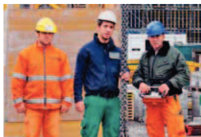
2 Kranführer, Anschläger und Monteur sind ein Team von Profis.